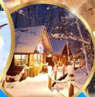
หมู่บ้านเทพนิยาย นิงเกิลทอเรส