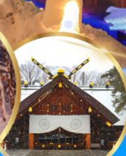
ศาลเจ้า ออกโทโต

เดินทาง 04 - 09 กุมภาพันธ์ 68 05 - 10 กุมภาพันธ์ 68