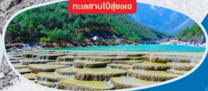
ทะเลสาบไป๋ส่วยเหอ