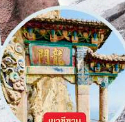
เขาชินชาน รวมกระเช้า+รถแบคเตอร์