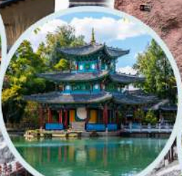
สระมังกรคำ