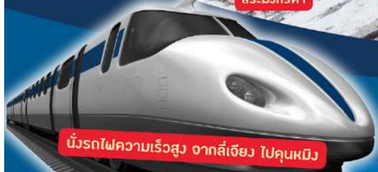
นั้งรถไฟความเร็วสูง จากลี่เจียง ไปคุณหมิง