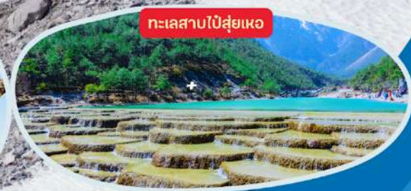
ทะเลสาบไ้สู่ยเหอ