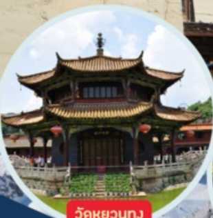
วัดหยวนทง