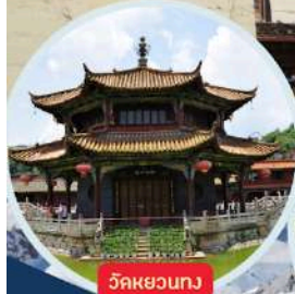
วัดหยวนทง