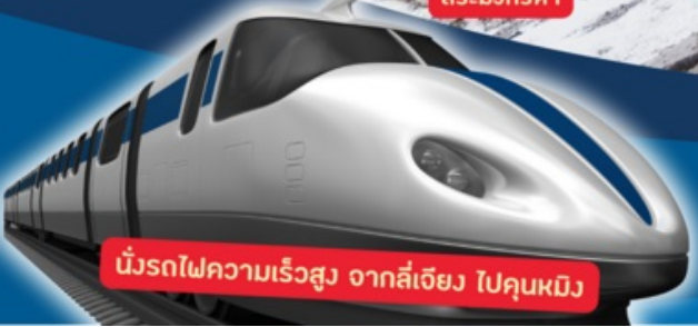
นั่งรถไฟความเร็วสูง จากสี่เฉียง ไปคุนหมิง