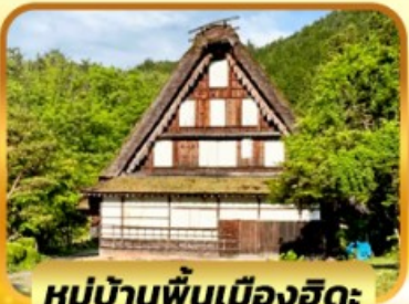
หมู่บ้านพื้นเมืองฮิดะ