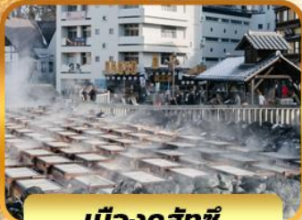
เมืองคุสัทชิ