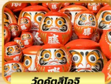
วัดคัตสึโงจิ