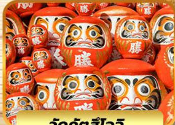
วัดคัตสึโอจิ