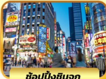
ช้อปปิ้งชินจูกุ