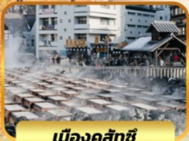
เมืองคุสัทซึ