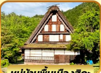
หมู่บ้านพื้นเมืองฮิดะ