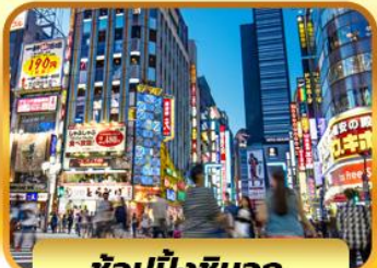
ช้อปปิ้งชินจูกุ