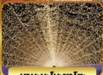
นาบะนะโนะซาโตะ