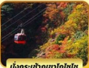
นั่งกระเช้าภูเขาโทโชไซ

ไฮไลท์ พิธี 4 ดาว ★★★★★ โอบาระ(ซากุระ) เมืองเกียวโต วัดคิโยมิสึ(วัดน้ำใส) หมู่บ้านชิราคาวาโกะ ถนนชั้นมาชิซุจิ สะพานนาคาบิชิ ซ้อปบิง ชินโซบาชิ ย่านซาคาเอะ อีออน