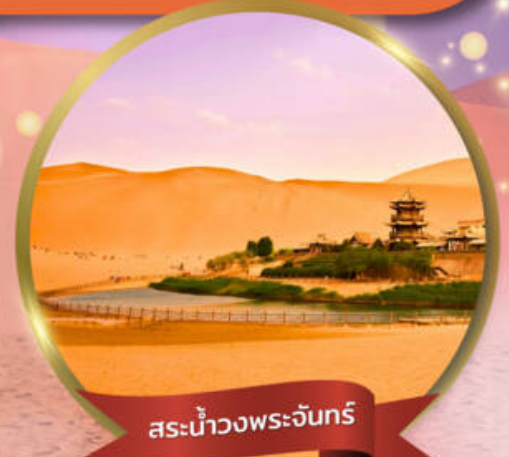
สระน้ำวงพระจันทร์