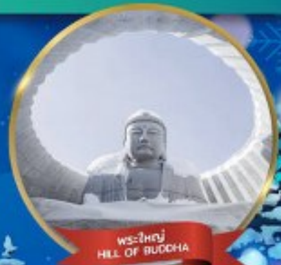
พระใหญ่ HILL OF BUDDHA