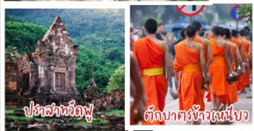
ปราสาทวัดพู