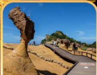
อุทยานหินเหย์หลิว