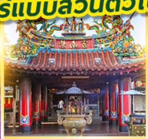
ศาลเจ้าจื่อหนานกง