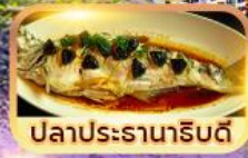
ปลาประธารินดี