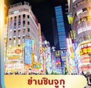
ย่านชินจูกุ