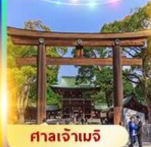
ศาลเจ้าเมจิ