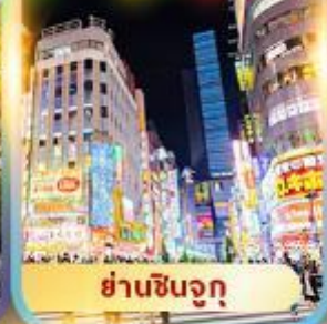
ย่านชินจูกุ