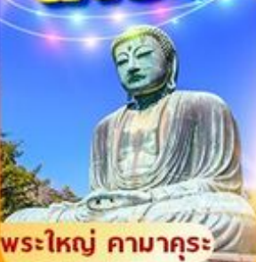
พระใหญ่ คามาคุระ