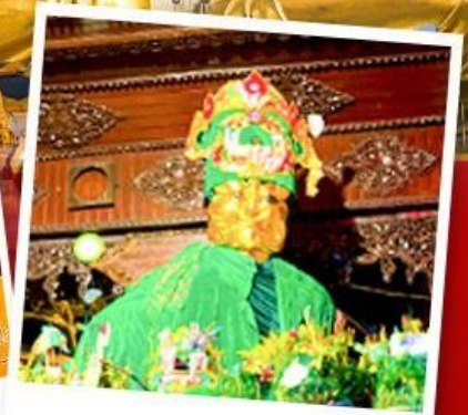
ขอพรมแม่ยักษ์