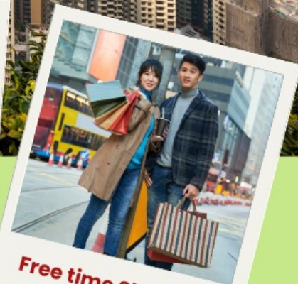
Free time Shopping