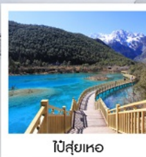
ไป๋สุ่ยเหอ

นั่งรถไฟความเร็วสูง จาก ลี่เจียง - คุณหมิง