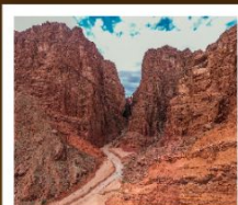
แกรนด์แคนยอนเทียนชาน