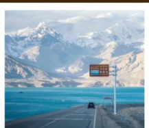
ทะเลสาบไป่ซาหู