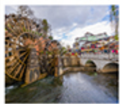
ເມັງໂບຣາເນສີ່ເຈີຍງ