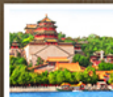
อวี่เหอหยวน