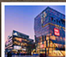
ย่านซานหลี่ตุ่น