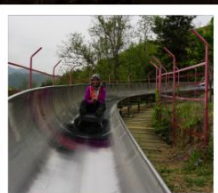
สไลเดอร์ลงจากกำแพงเมืองจีน