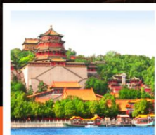
อวิ๋เหอหยวน