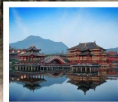
หึงเตี้ยน

ศูนย์ค้าส่งเมืองอี้อู / Hengdian World Studio / พระราชวังหมิงซิง พระราชวังจำลองจินซีอ๋องเต้ / โรงภาพยนตร์ชิงหมิงช่างเหอญู ถนนคนเดินกวางโจวและฮ่งกง / อุทยานสรวงสวรรค์สี่นเสวียจิว สะพานหฺรูอี้ / สะพานมิงกร / ล่องเรือทะเลสาบซีหู / ห้าง INN77 ถนนโบราณเหอฝ่งเจีย / สะพานกงเงิน / ถนนโบราณเสี่ยวเหอ