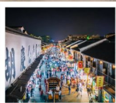
ถนนโบราณเหอฝ่งเจีย