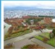
โทริยิวกะกุ ทาวเวอร์

หุบเขานรกจิโตะคุตานิ / โทดองฮังของคานามิชิ ตลาดเช้าเมืองฮาโกดาเตะ / โทริยิวกะกุ ทาวเวอร์ ภูเขาไฟอุสุ / จุดชมวิวยุซึกิ / ค่องเรือชมทะเลสาบโทบะ สวนอุสึกิโตะ / สวนพฤกษศาสตร์ / เก็บผลไม้ / สัมผัสน้ำพุร้อนทิวย พิพิธภัณฑ์หอค่องดนตรี / นาฬิกาไอน้ำโบราณ / โรงเบียร์แก้วคิตาฮิชิ เนินพระพุทธรเจ้า / ถนนฮิโอบังทากุทากิ / ย่านซูซุกิโนะ