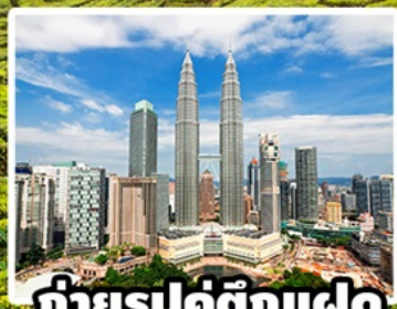
ถ่ายรูปคู่ตึกแฝด