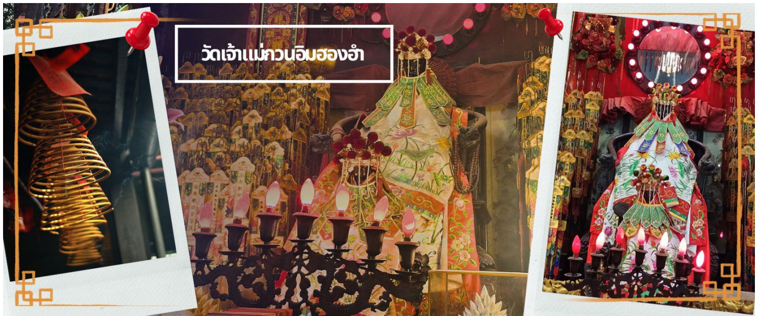
วัดเจ้าแม่กวนอิมฮองฮ่า

จากนั้นนำท่านชม โรงงานจิวเวอรี่ ซึ่งเป็นโรงงานที่มีชื่อเสียงที่สุดของฮ่องกงในเรื่องการออกแบบเครื่องประดับ อาทิเช่น จี้ และแหวนกำหั้น ที่สวยงามโดดเด่นไม่เหมือนใคร ซึ่งถือกำเนิดขึ้นที่นี่และมีชื่อเสียงที่สุดใช้เป็นเครื่องประดับติดตัว และเสริมดวงชะตา สินค้าทุกชิ้นมีเอกสารรับประกันคุณภาพเปลี่ยน ซ่อม ได้ตลอดอายุการใช้งาน หากเกิดการชำรุดจากสินค้าไม่ใช่อุบัติเหตุ