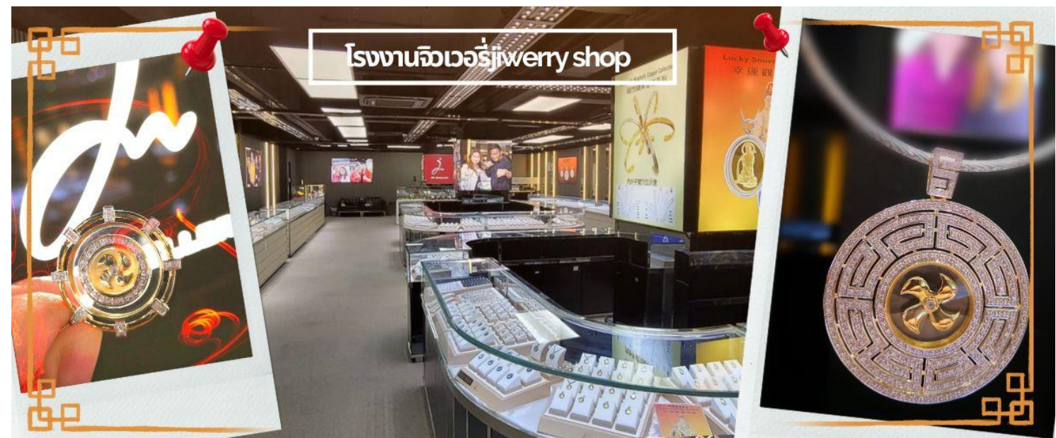
โรงงานจิวเวอรี่ jewelry shop

จากนั้นนำท่านชม โรงงานจิวเวอรี่ ซึ่งเป็นโรงงานที่มีชื่อเสียงที่สุดของฮ่องกงในเรื่องการออกแบบเครื่องประดับ อาทิเช่น จี้ และแหวนกำหั้น ที่สวยงามโดดเด่นไม่เหมือนใคร ซึ่งถือกำเนิดขึ้นที่นี่และมีชื่อเสียงที่สุดใช้เป็นเครื่องประดับติดตัว และเสริมดวงชะตา สินค้าทุกชิ้นมีเอกสารรับประกันคุณภาพเปลี่ยน ซ่อม ได้ตลอดอายุการใช้งาน หากเกิดการชำรุดจากสินค้าไม่ใช่อุบัติเหตุ