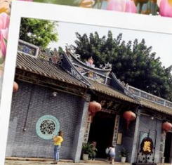
วัดกวนอูเซินเจิ้น