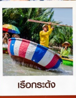
เรือกระดัง