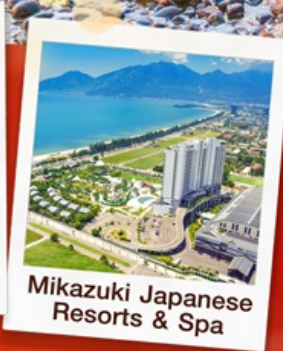
Mikazuki Japanese Resorts & Spa