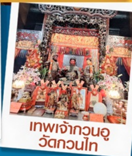
เทพเจ้ากวนอู วัดกวนไท่