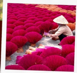
หมู่บ้านรูง