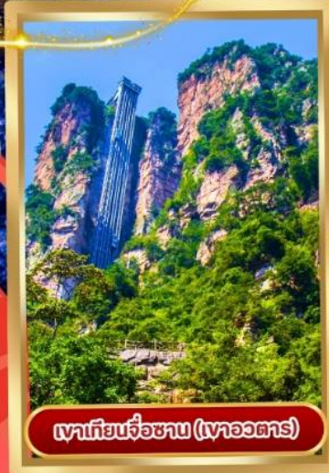
เขาเทียนจื่อซาน (เขาวงตาร)