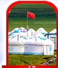
หมู่บ้าน พื้นเมือง