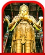
วัดกานดา