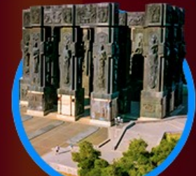
อนุสาวรีย์ประวัติศาสตร์

48,000 23-28 ต.ค. 67 เหลือ 10 ที่ 41,111