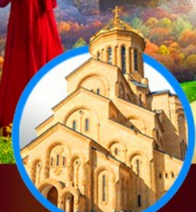
โบสถ์กรินดี เมืองทบิลีซี