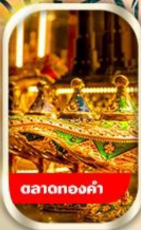
ตลาดทองคำ