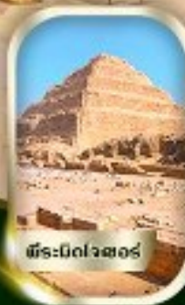
พีพีร์เมืองลอส