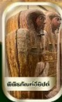
พีพีร์กับอียิปต์