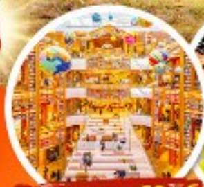
ห้องสมุดสตาร์ฟิสต์