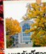
เมฆาคับช็องวา