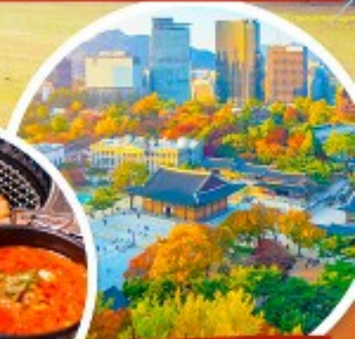
พระราชวังเคียงอกซุกุง