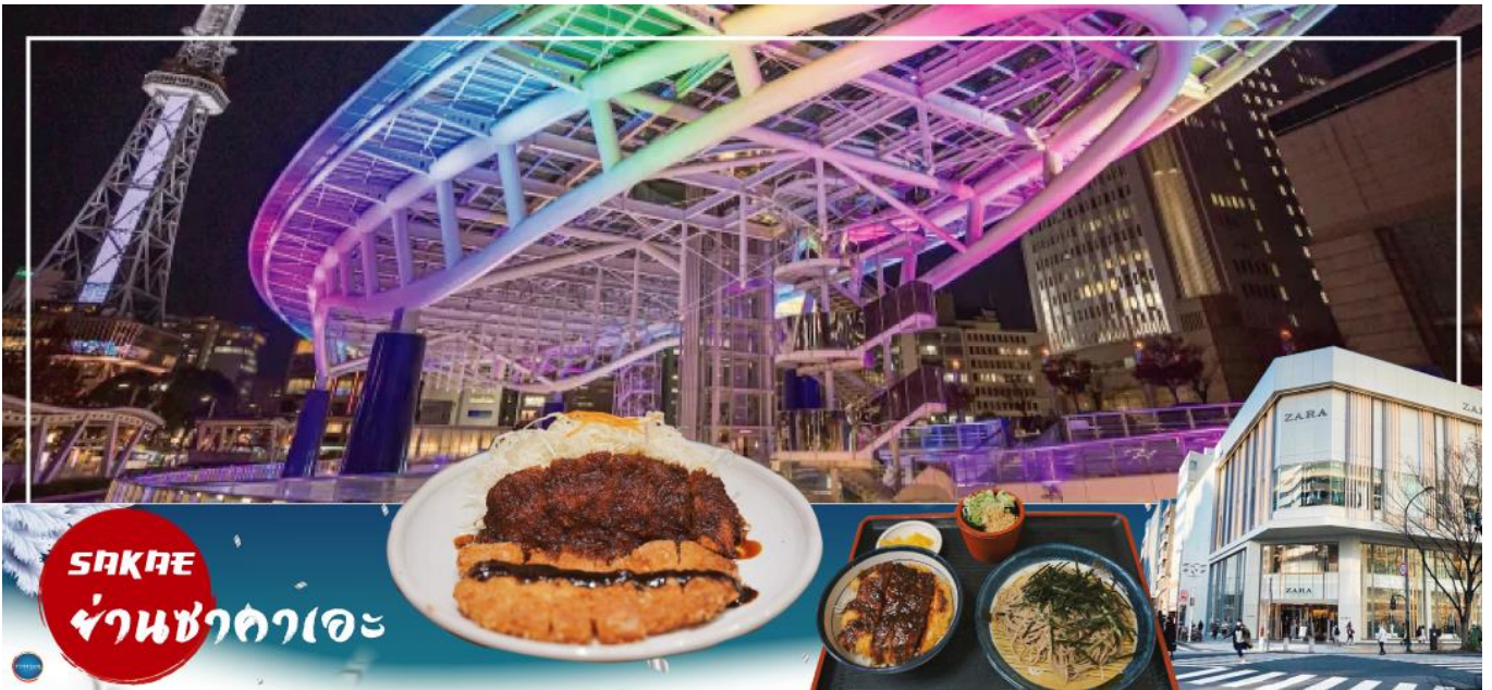
ค่า อีสระรับประทานอาหารค่ำตามอัธยาศัย

อีสระให้ท่านเดินเล่นช้อปปิ้ง ย่านซาคาเอะ (Sakae) เป็นย่านธุรกิจการค้า โดยเฉพาะแหล่งราตรี เช่น คลับและบาร์ มีห้างสรรพสินค้ามัตสึซากาเอะ หรือ เมืองใต้ดิน (Central Park) แหล่งรวมแฟชั่นและร้านค้าสุดเก๋มากมาย เช่น ร้านเสื้อผ้า, ร้านของใช้กระจุกกระจิก, ร้านชาลอนความงาม เป็นต้น แฟชั่นไฮโดลญี่ปุ่น ห้ามพลาด ต้องมาเยือนห้างสรรพสินค้าชั้นไนซ์ ซาคาเอะ ซึ่งเป็นจุดศูนย์กลางแหล่งรวมความบันเทิงมากมาย ที่มี Grand Canyon ฮอลล์จัดคอนเสิร์ตศิลปินไฮโดลและยังเป็นคาเฟ่ นอกจากนี้ที่นี่ยังเป็นสถานที่ตั้งของ "ชิงช้าสวรรค์ Sky Boat" แลนด์มาร์คของย่านนี้อีกด้วย อีสระเพลิดเพลินย่านนี้ตามอัธยาศัย