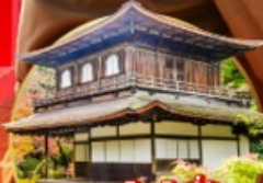
ชมสวนสโตนี่ญี่ปุ่น... Ginkakuji Temple