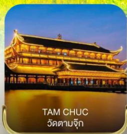
TAM CHUC วัดตามจุก