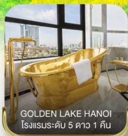
GOLDEN LAKE HANOI โรงแรมระดับ 5 ดาว 1 คืน