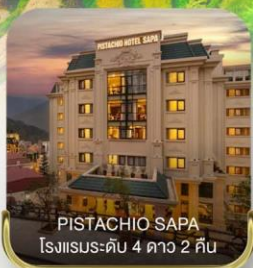
PISTACHIO SAPA โรงแรมระดับ 4 ดาว 2 คืน