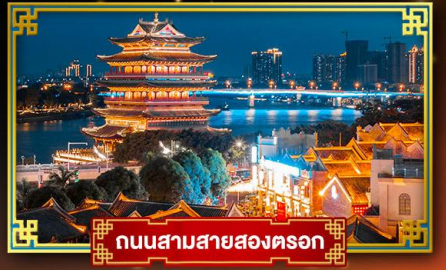
ถนนสามสายสองนคร