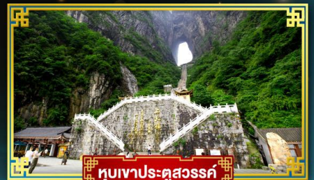
หุบเขาประตูสวรรค์