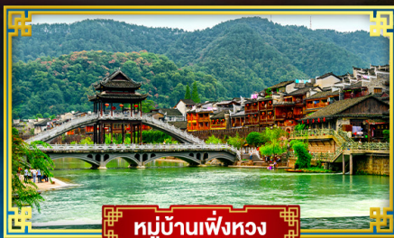
หมู่บ้านเฟิ่งหวง

ขุนเขามรดกโลกกลางสาขามอ "ฟ่านจิ่งซาน" ท่องสูดดินแดนแห่งภาพวาดจางเจียเจีย