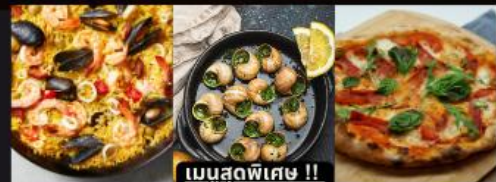
PAELLA ข้าวผัดสเปน / หอยแครงสด / พิซซ่ามาการิตต้า