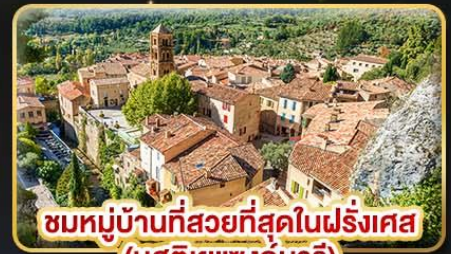
ชมหมู่บ้านที่สวยงามที่สุดในฝรั่งเศส (บูสตีเยแซงท์มารี)