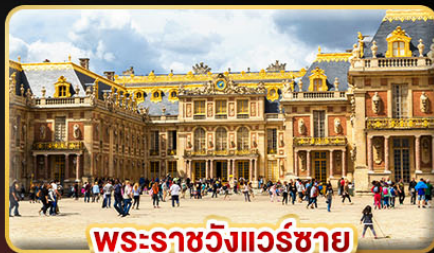
พระราชวังแวร์ซาย