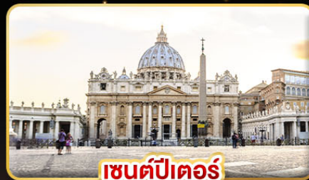
เซนต์ปีเตอร์