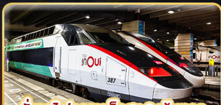
นั่งรถไฟความเร็วสูง 2 เส้นทาง PARIS - LYON & VENICE - ROME

✈️ เดินทาง : 11-20 ก.พ. 68 / 15-24 มี.ค. 68 05-14 เม.ย. 68 / 29-08 พ.ค. 68