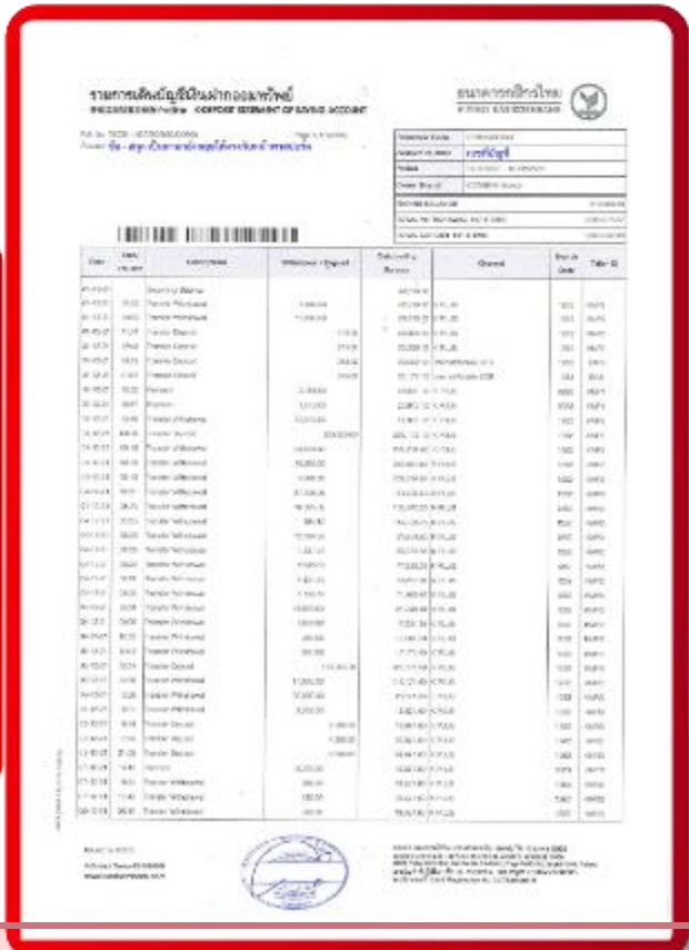
ตัวอย่าง Bank Statement ที่ผู้สมัครต้องขอกับธนาคาร

3.4 ปรับสมุดบัญชีธนาคารตัวจริง และเตรียมไปในวันที่ยื่นวีซ่า