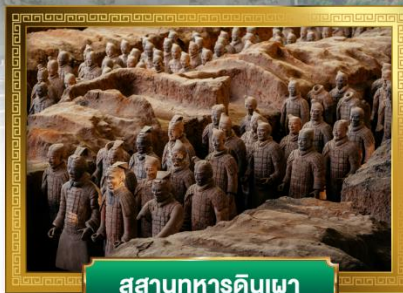
สุสานทหารดินเผา