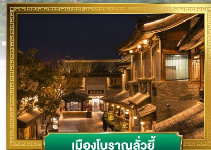
เมืองโบราณลั่วอี้