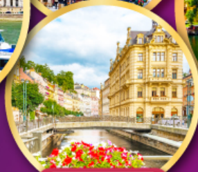
คาร์โลวารี