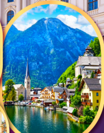
ฮัลล์สตัดท์