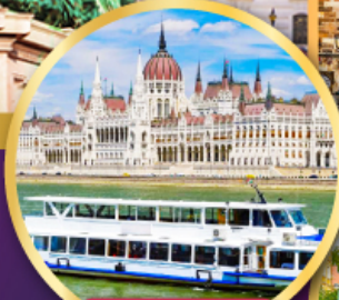
ล่องเรือ แม่น้ำดานูบ