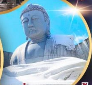
เนินเขาแห่งพระพุทธรเจ้า