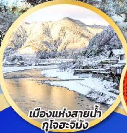
เมืองแห่งสายน้ำ กุโจะจิมัง