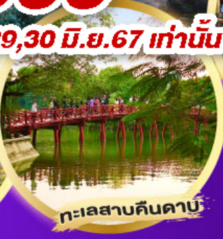
ทะเลสาบคินคาบ