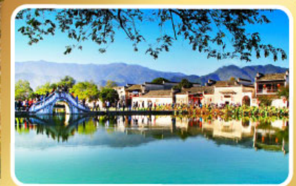
หมู่บ้านผดกโลก หงซุน