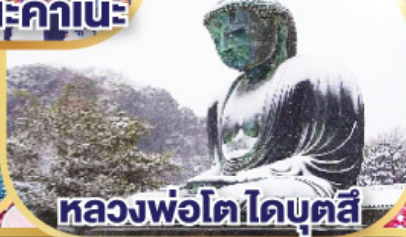
หลวงพ่อดาโดบุตสึ