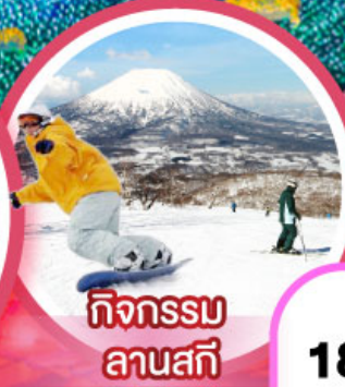
กิจกรรม ลานสกี

เดินทาง 18-23, 21-26 ก.พ. 68 14-19, 20-25 ก.พ. 68