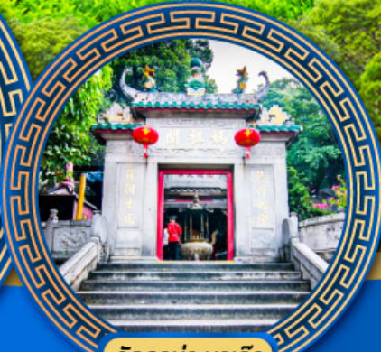
วัดอาม่า มาเก๊า