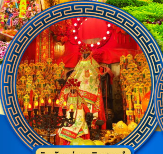
วัดเจ้าแม่กวนอิมสองห้า