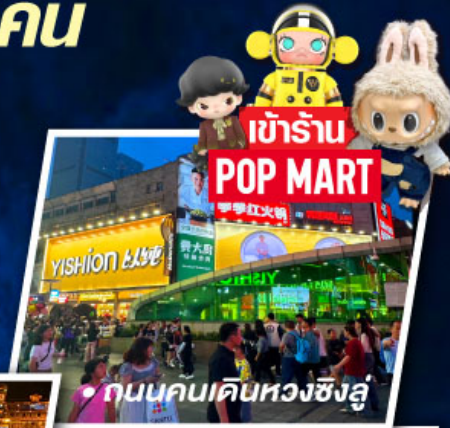
• ถนนคนเดินหวงซิงหลู