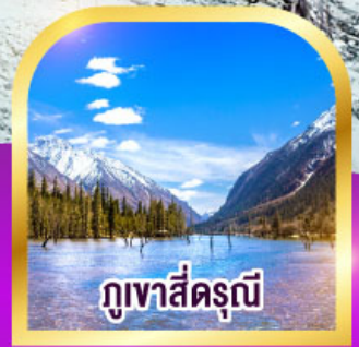
ภูเขาสัตร์ณี